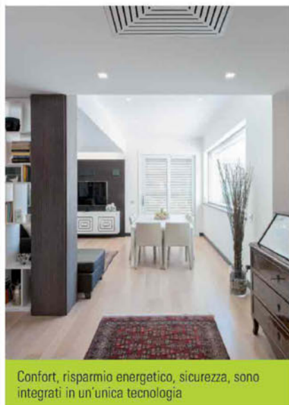
Confort, risparmio energetico, sicurezza, sono integrati in un'unica tecnologia

Quali sono, secondo lei, le soluzioni più innovative utilizzate in questo impianto? "La possibilità di controllo da remoto attraverso smartphone e la funzione 'Energy Guard', che traccia un profilo energetico preciso dei consumi dell'abitazione".